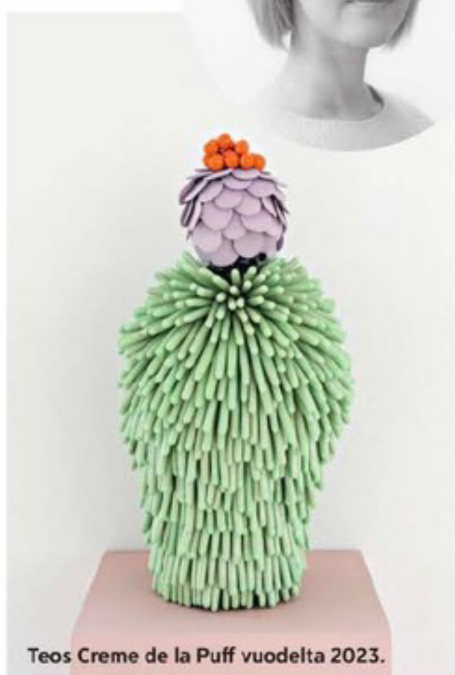
Teos Creme de la Puff vuodelta 2023.